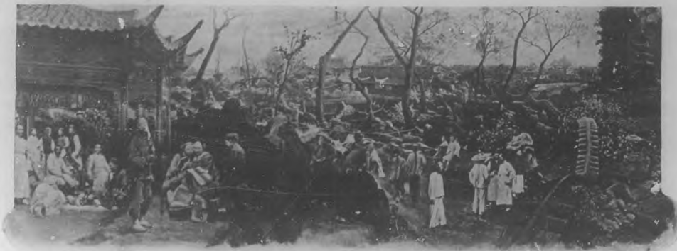
Vista panorámica de Shanghai.

También habrán visto cuántos son los kilómetros de vía férrea en explotación, y cuántos y de qué importancia son los proyectos de nuevas vías de comunicación.