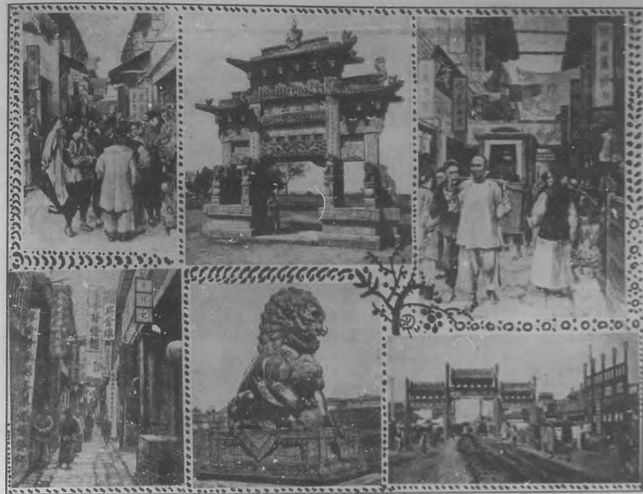
China pintoresca.—1 Curiosidad china en una calle de Pekin.—2 Puerta de honor en Tsing chi fu.—3 Puerta (terra china)—4 Una calle de Canton.—5 Estada de un león, situada delante del palacio imperial de verano en Pekin.—6 Puerta de honor en Kianchi.

La escuadra china la componen cuatro cruceros, á saber: "Hai-Chi", "Hi Tchen", "Hai Yong" y "Hai Tchen"; dos cruceros torpederos, "Fou Ying" y "Fel Ting"; dos avisos torpederos, "Kien Wie" y "Kien Knag", y ocho cruceros viejos: "Yi Sing", "Yan Pao", "Sin Ying", "Fou Tsing", "Pao Min", "King Tching", "Nan Ting" y "Nan Chouing".