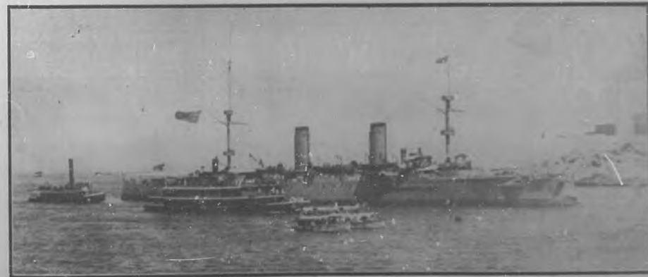
El crucero acorazado de la marina china "Hai-Chi", entrando por el Puerto.

do de la animada serie de actos á que han dado lugar los marinos chinos.