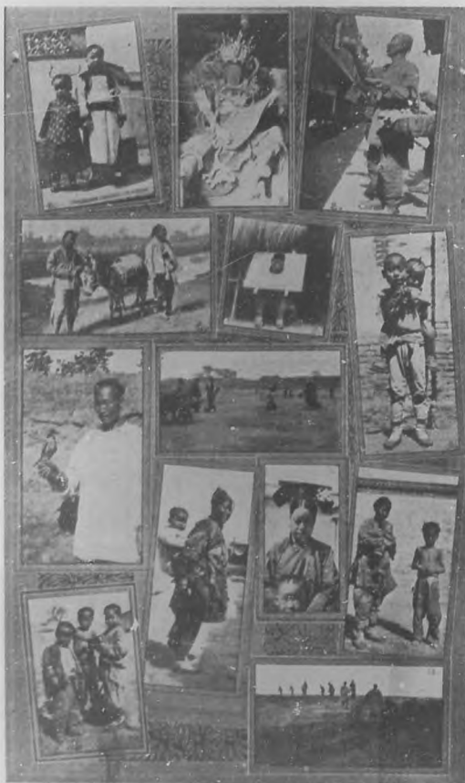
Tipos y costumbres chinas.

La oficialidad se va obteniendo en academias navales bien organizadas y establecidas en Che fou, donde hay actualmente 200 estudiantes y en Nau King, donde se instruyen 140 con instructores ingleses, habiendo arsenales y otros establecimientos navales en Kanton, Foutcheou y Woutchang.