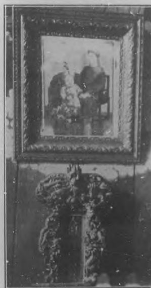
Retrato del emperador y emperatriz del Celeste Imperio cuya copia se halla en la Legación de China en Cuba.